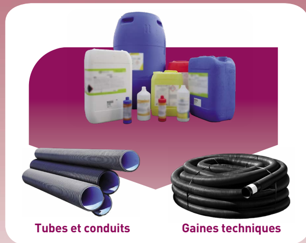
Tubes et conduits